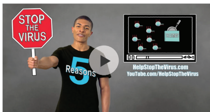
5 Reasons to Stick to HIV Treatment

Check out HelpStopTheVirus.com for more prevention information. And watch videos about HIV medicines, testing, and the importance of sticking to daily treatment.